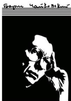
The Boris Tchaikovsky Society

© Межрегиональная общественная организация содействия изучению и сохранению творческого наследия композитора Бориса Чайковского, 2025 © Прохоров И. О., 2025